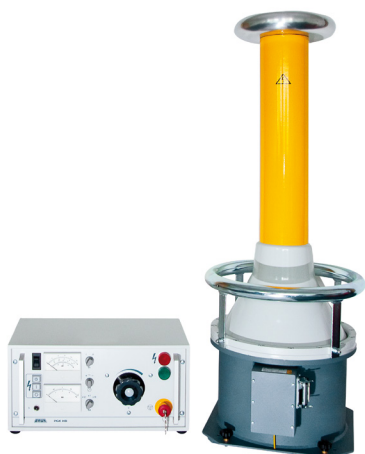
Ilustración a modo de ejemplo