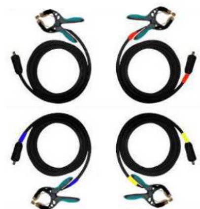
Cables de corriente