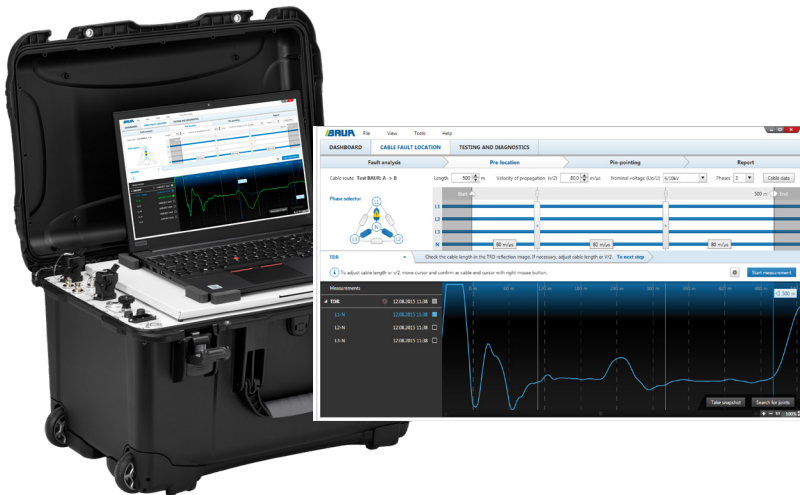
La ilustración y la captura de pantalla son ejemplos