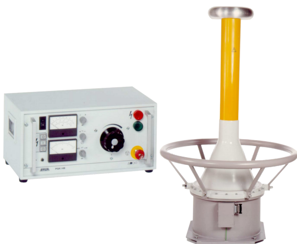
Ilustración a modo de ejemplo