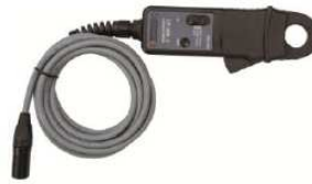
Pinza de corriente 30/300 A con extensión de 5 m