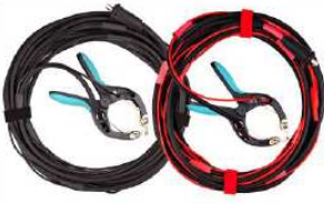
Cables de corriente y tensión con pinzas TTA