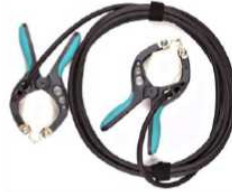
Cable de conexión de corriente con pinzas TTA