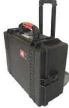
Maleta de plástico para cables con ruedas