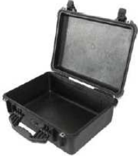
Maleta de plástico para cables