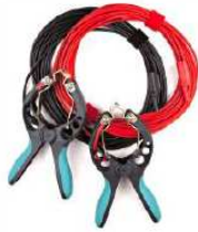
Cables de tensión con pinzas TTA