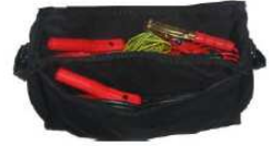
Bolsa para cables